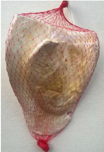
Orejas de Res Malla x 2 unid