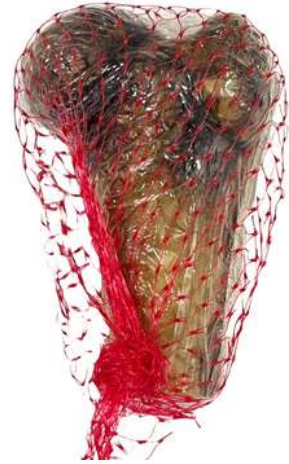
Mini Cerdo 1 Unidad