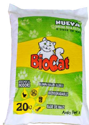
Arena de Maíz Bolsa x 20 kg