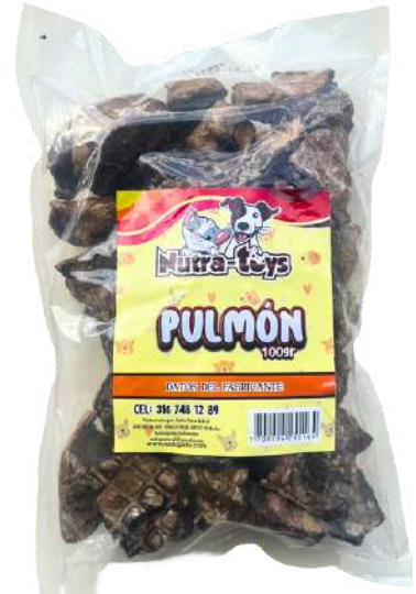
Pulmón Bolsa x 100 gr