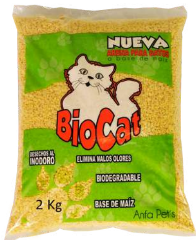
Arena de Maíz Bolsa x 2 kg