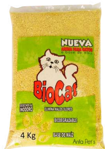
Arena de Maíz Bolsa x 4 kg