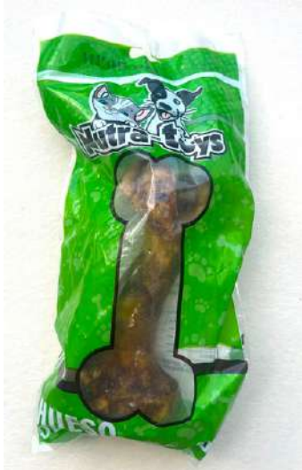
Fémur de Cerdo Bolsa x 1 unid