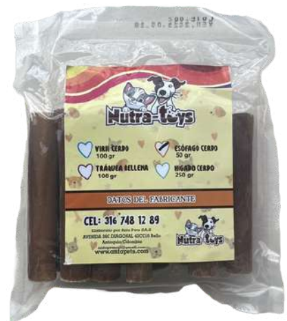
Esófago de cerdo Bolsa x 50 gr