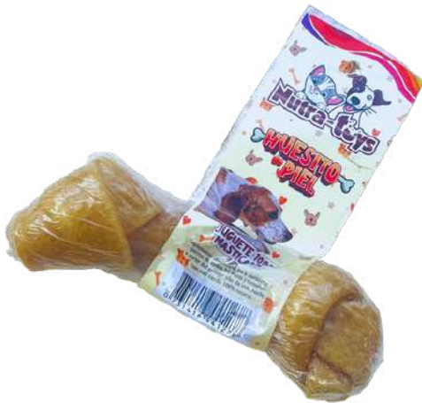
Huesito de Piel 1 unidad