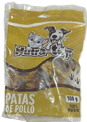
Patatas de pollo Bolsa x 100 gr