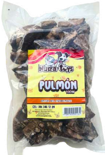
Pulmón Bolsa x 200 gr