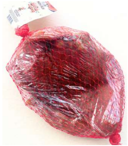
Orejas de Cerdo Malla x 2 unid