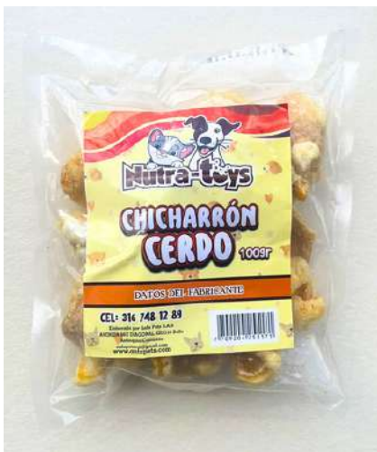
Chicharrón Bolsa x 100 gr