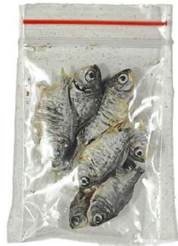
Peces Bolsa x 10 UND