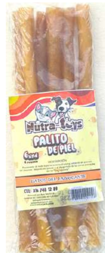
Palito de Piel Paquete x 6 unid.