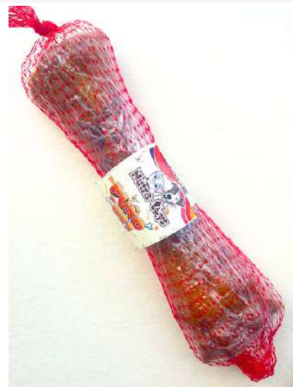
Puño de Res 1 unidad