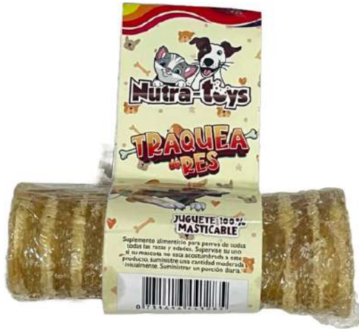
Traquea de Res 1 Unidad