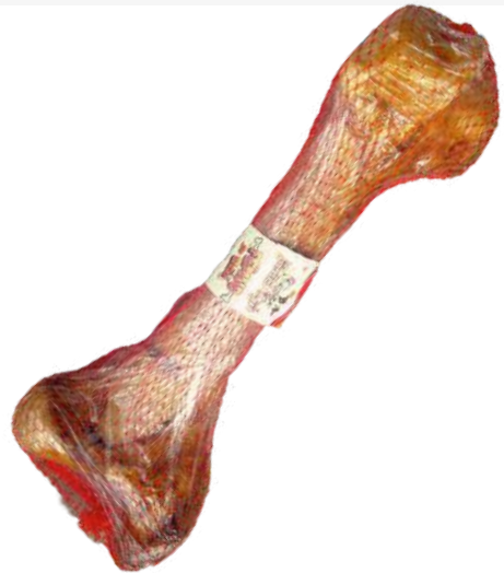
Fémur de Res Malla x 1 unid