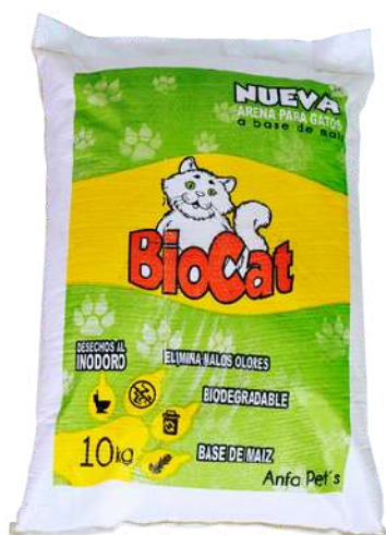
Arena de Maíz Bolsa x 10 kg