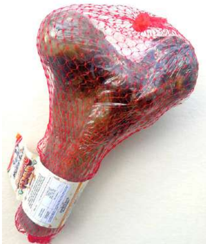
Medio Fémur Res 1 unidad